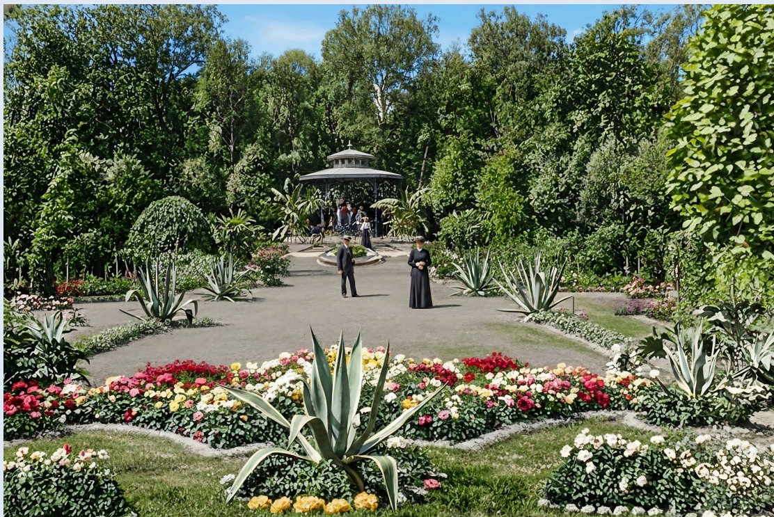
Rosengarten in Kolberg (Foto mit KI bearbeitet)