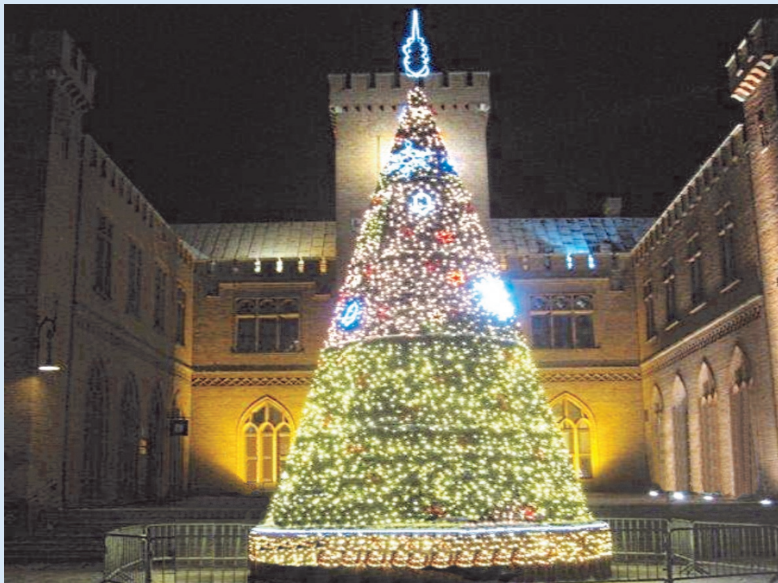
Weihnachtsbaum vor dem Kolberger Rathaus

in Zusammenarbeit mit der Vereinigung ehemaliger Bürger - dem Heimatkreis Kolberg