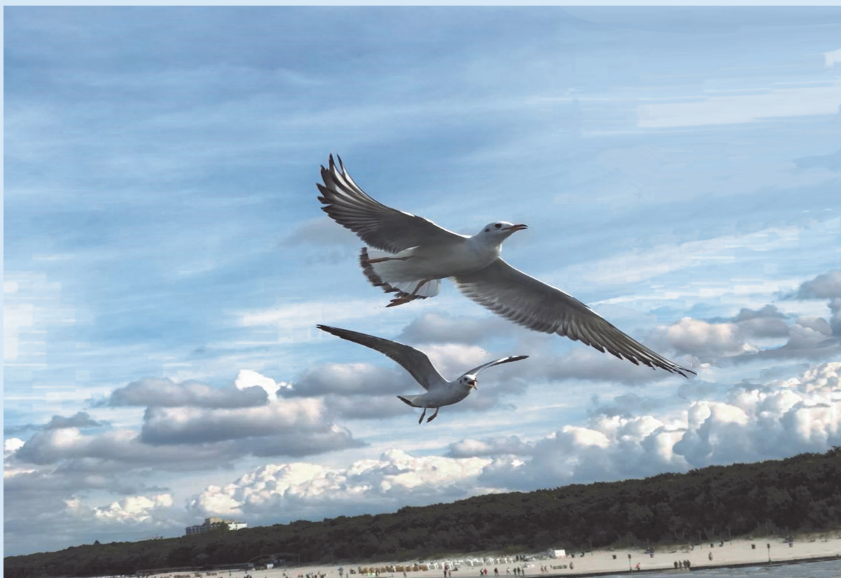
Möwen über dem Strand von Kolberg

in Zusammenarbeit mit der Vereinigung ehemaliger Bürger - dem Heimatkreis Kolberg