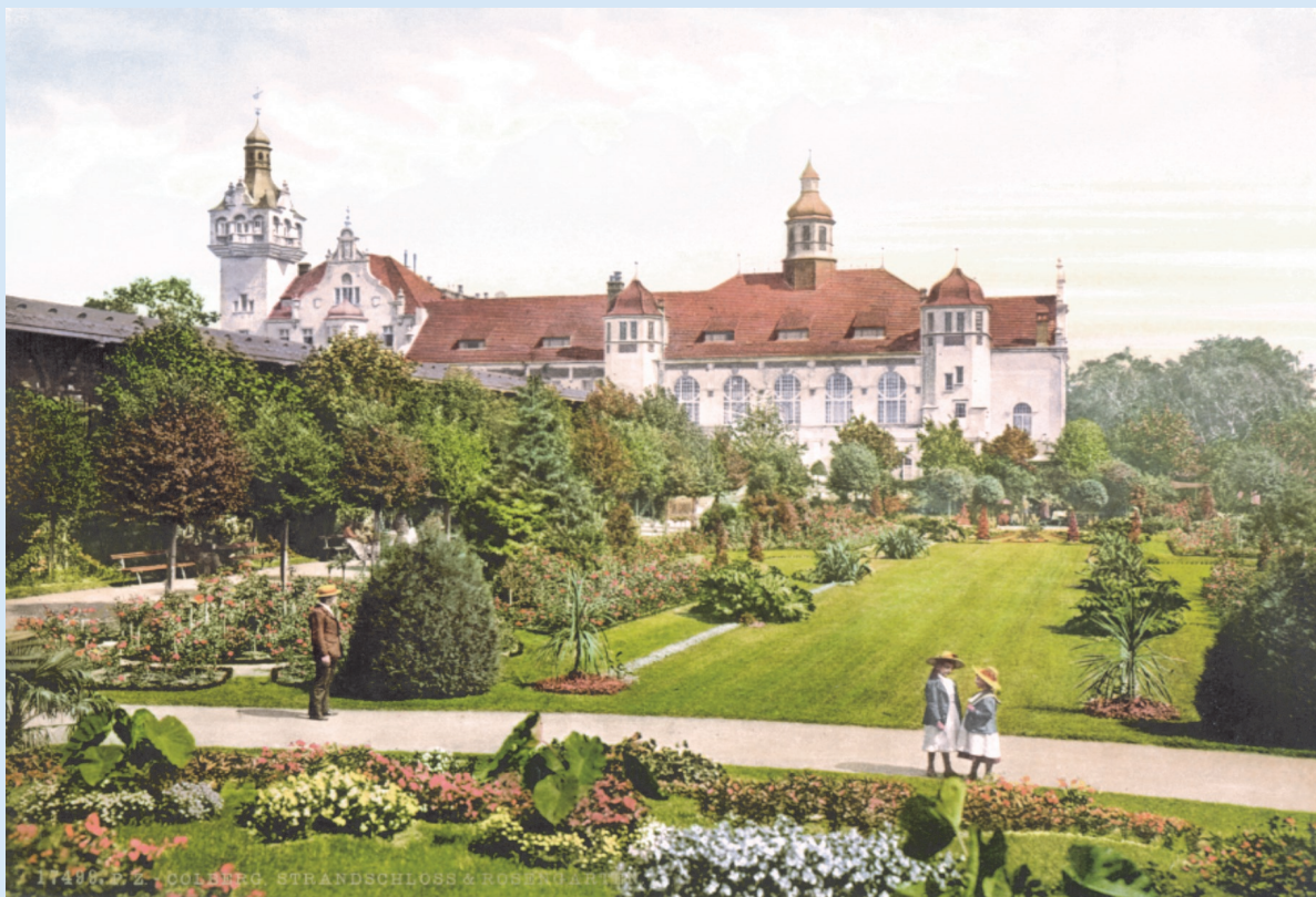
Kolberger Rosengarten (Strandschloss im Hintergrund)

in Zusammenarbeit mit der Vereinigung ehemaliger Bürger - dem Heimatkreis Kolberg