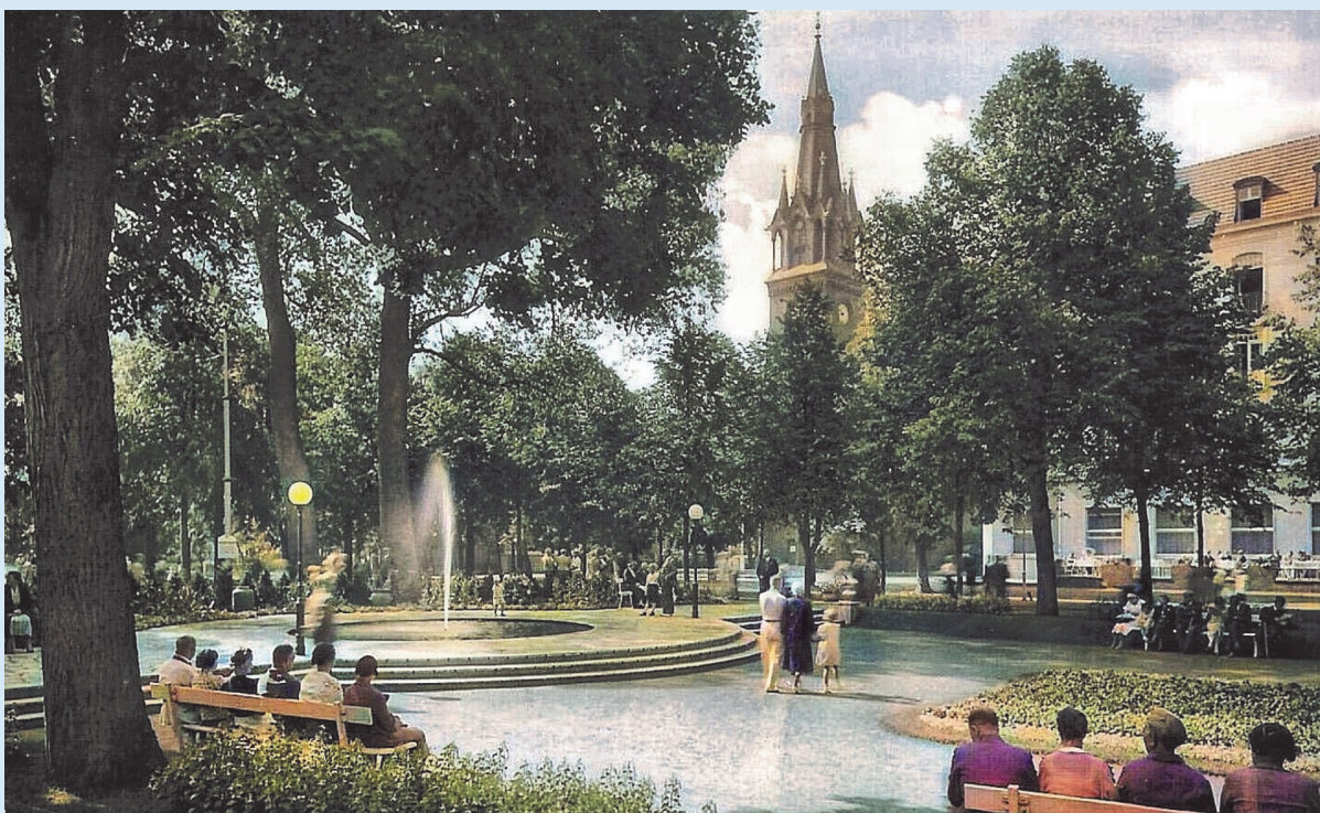
Frühkonzertplatz in Kolberg mit St. Nikolaikirche im Hintergrund

in Zusammenarbeit mit der Vereinigung ehemaliger Bürger - dem Heimatkreis Kolberg