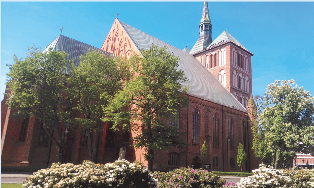
St. Marien Dom in Kolberg (Aufnahme Mai 2016)

in Zusammenarbeit mit der Vereinigung ehemaliger Bürger - dem Heimatkreis Kolberg